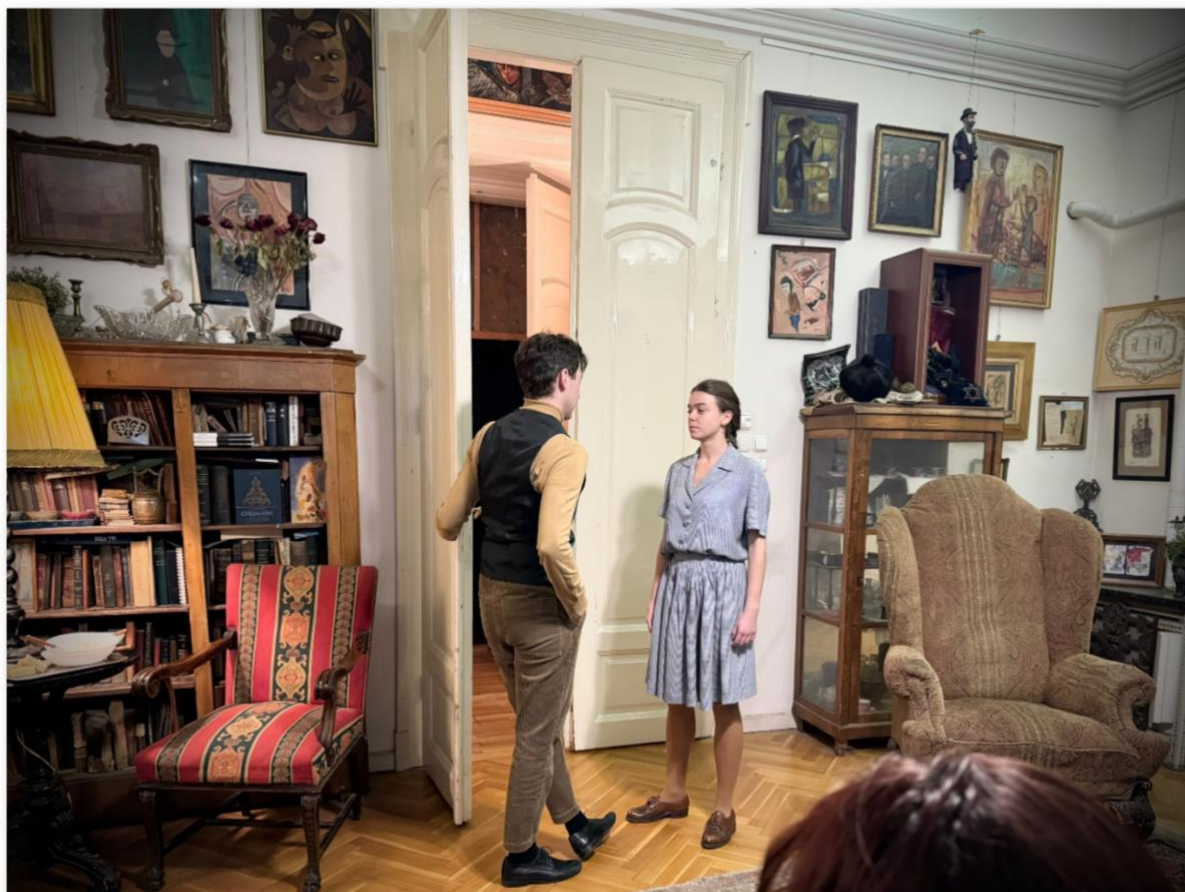
Édes Anna – FREESZFE – KuglerArt Szalon. – Foto: Imolai Judit 2024.nov.14.

tennivalókat, hatalmas hangzavarban tetőzik a káosz, ebben az egyre hangosabb kiabálásban Anna magáról kívülállóként beszél. „Nincs olyan, amit ne lehetne rábízni, és nincs olyan, amit ne tenne meg.” Természetes megjelenéssel, mégis súllyal és nagy hatással játszik, Anna alakításának két csúcspontja a szerelmi jelenetek és a gyermeke elvetélése. A csábítás idejében a játékosságban kamaszos naivitás és vidámság érzete sugárzik, a magzatelhajtás után fájdalom és mély sodródó zuhanás sajdítja a szívet. Anna kiszolgáltatott helyzetére és a veszteség fájdalmára nincsenek szavak, a lány a szoba közepén kesergőt, egy népdalt énekel. Az intimitás érzékeltetése egyaránt zseniális a rendezői megoldásokban is a nappali közepén, és a színészek játékában is. A néző testközelből tapasztalja meg az áramló érzelmeket.