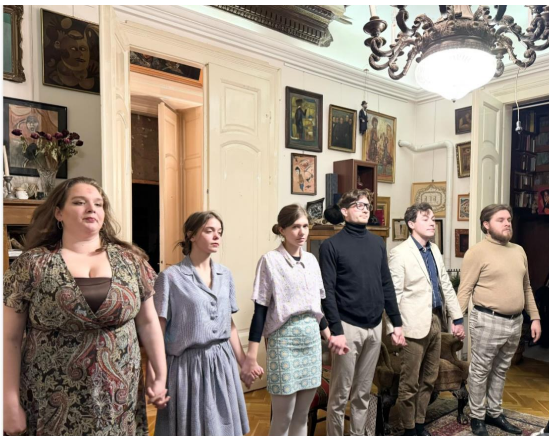
Édes Anna – FREESZFE – KuglerArt Szalon. – Foto: Imolai Judit 2024.nov.14

De a korona is egyre hull. Árfolyama: 0,22. Az emberek kétségbeesnek, hogy lehet majd ily alacsony árfolyam mellett enni, ruházkodni, fűteni, s remegve tekintenek a közelgő tél elé.”